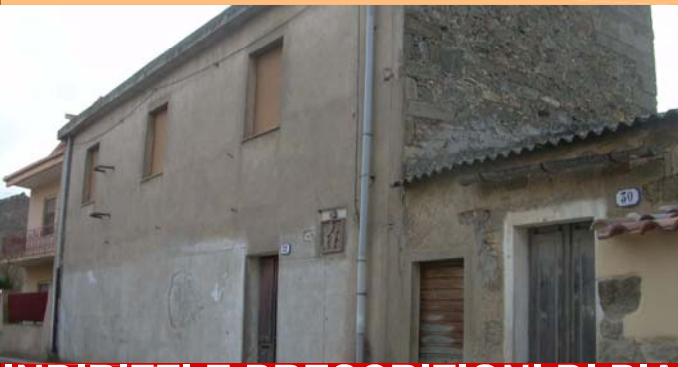
Schema tipologico di riferimento