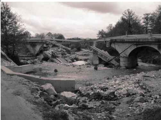
Villanova Alluvione dic. 2004 - Ponte SS 389