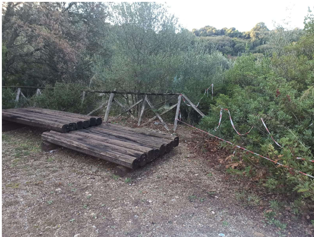
Immagine 3 – ripristino staccionate e potatura arbusti