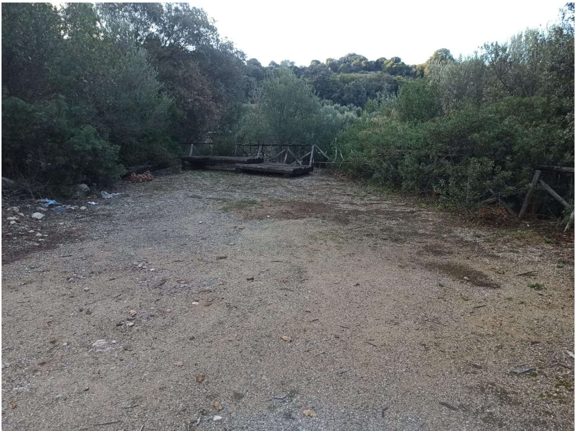
Immagine 12 – Eliminazione arbusti e rimozione rifiuti e ripristino staccionata