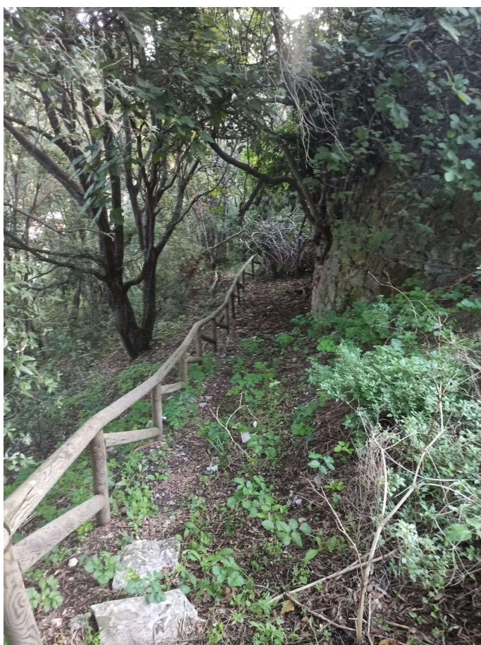
Immagine 4 – pulizia sentiero, rimozione detriti e decespugliatura