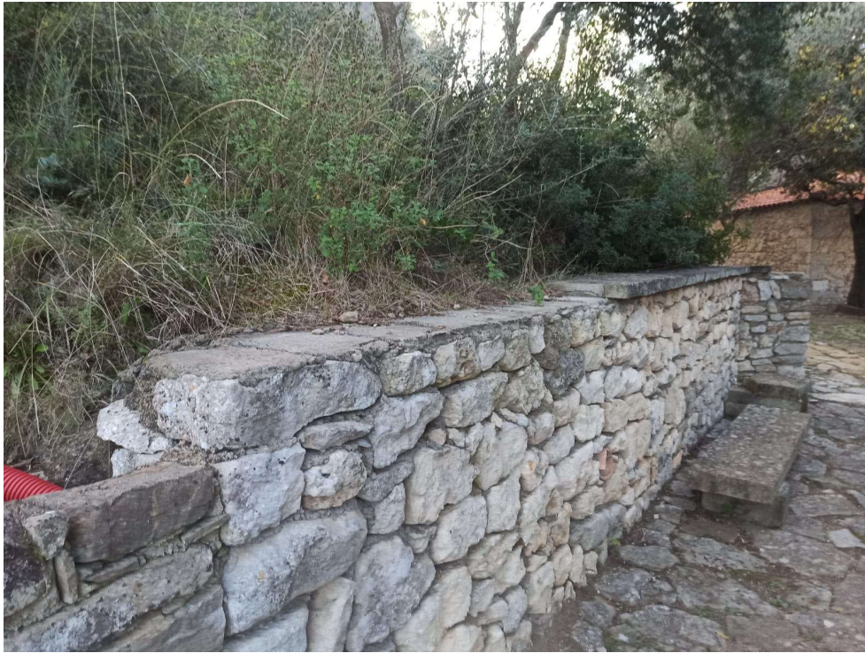
Immagine 5 – ripristino muretto a secco