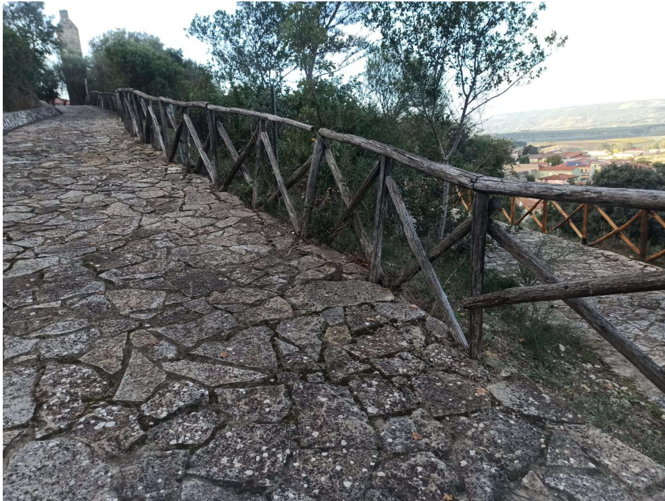
Immagine 1 –staccionate da ripristinare