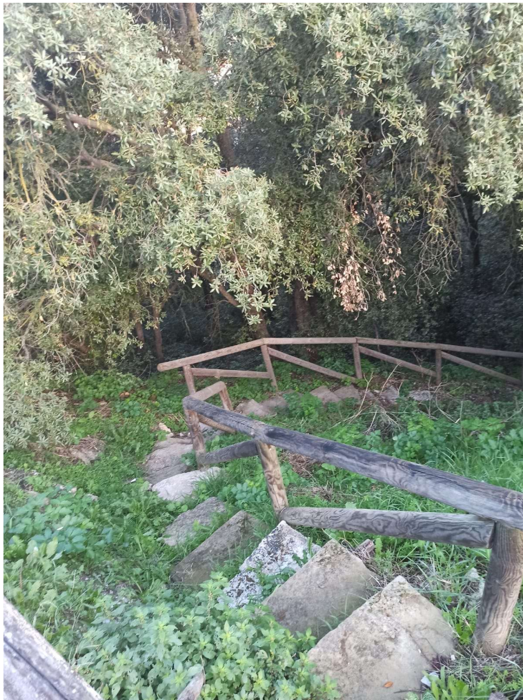
Immagine 6 – Eliminazione arbusti e decespugliamento a mano della macchia e delle erbacee che invadono i camminamenti