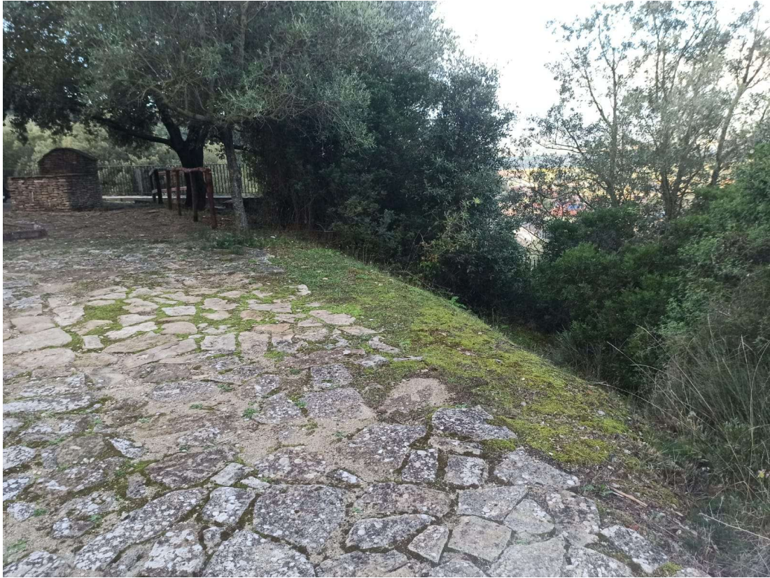
Immagine 7 – ripristino staccionate e potatura arbusti e sistemazione sentiero