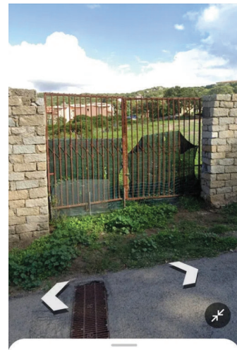
63 Via Campo Sportivo