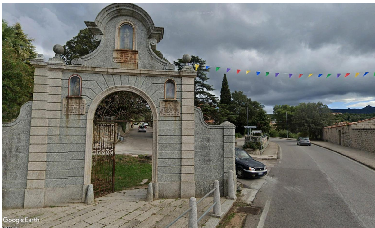
Lu pultoni di Frati

In particolare gli interventi previsti riguardano prioritariamente la realizzazione di: sentieri, percorsi ciclabili e camminamenti con relativa segnaletica e cartellonistica, aree di sosta attrezzate, adeguamento e riqualificazione di edifici per la realizzazione di centri di valorizzazione / documentazione / fruizione.