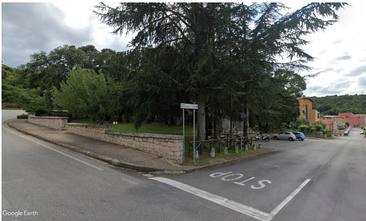
Parco Urbano Piazza Cassitta