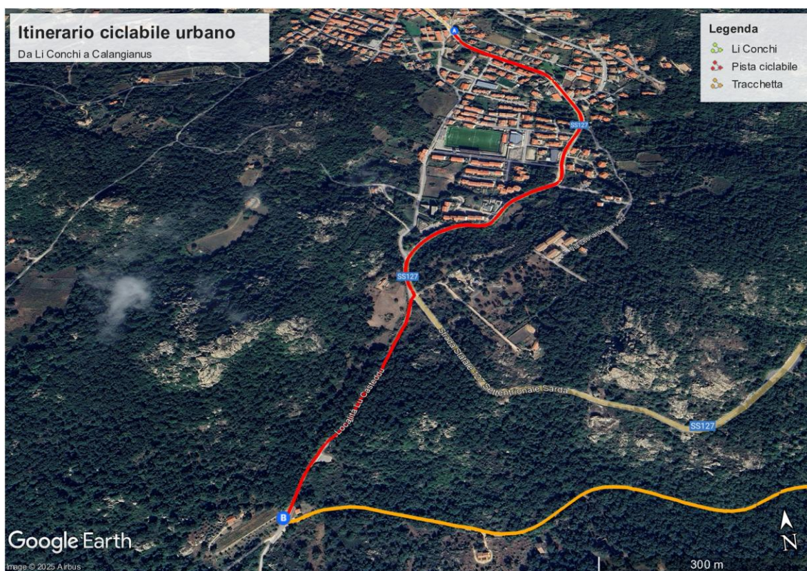
Tratto 1: tratto urbano da “ Lu pultoni di lu fratu ” a “ Tracchetta ”