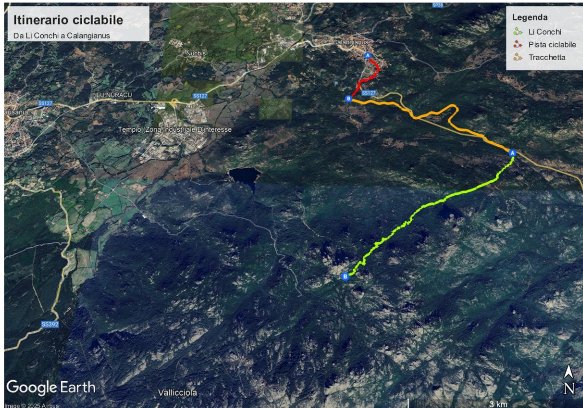
Immagine satellitare dell'itinerario completo

In quest'ottica si ritiene fondamentale creare collegamenti pedonali e ciclabili tra i numerosi parchi e giardini presenti nel centro abitato e gli antichi camminamenti e percorsi presenti nel territorio: l'itinerario ciclopedonale della ex ferrovia - Monti (stazione Monti-Telti) – Tempio Pausania, itinerario n.39) del PIANO REGIONALE DELLA MOBILITÀ CICLISTICA DELLA SARDEGNA e il percorso storico utilizzato per la transumanza che conduce fino alla località di “ Li Conchi ” sulla sommità del massiccio del Limbara, ultimamente recuperato e riqualificato con intervento ricompreso all'interno della programmazione territoriale della RAS, “ Sistema per la valorizzazione sostenibile del patrimonio storico ambientale ai piedi del massiccio del Limbara ” nel comune di Calangianus, a valere sui fondi del CRP PT- 10-5- La Città di Paesi della Gallura .