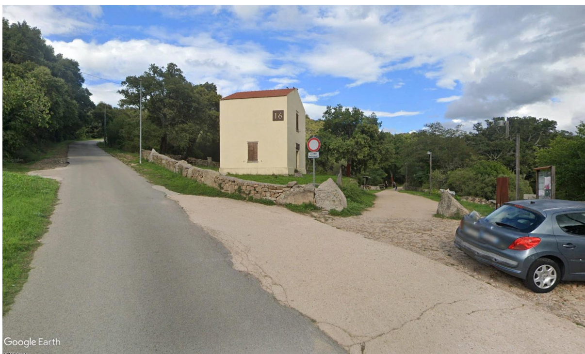
Tracchetta: Casa Cantoniera 16 - Tratto del percorso n.39 Monti (stazione Monti-Telti) – Tempio Pausania, del PIANO REGIONALE MOBILITÀ CICLISTICA DELLA SARDEGNA.