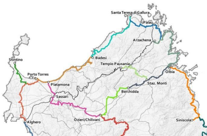
Planimetria itinerari PIANO REGIONALE MOBILITÀ CICLISTICA DELLA SARDEGNA