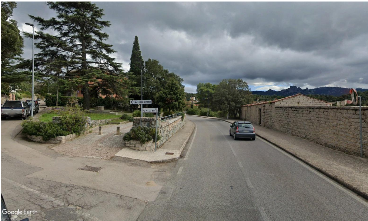
Giardino in Via Olbia