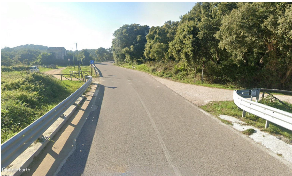
Tracchetta: Casa Cantoniera 15- Tratto del percorso n.39 Monti (stazione Monti-Telti) – Tempio Pausania, del PIANO REGIONALE MOBILITÀ CICLISTICA DELLA SARDEGNA.