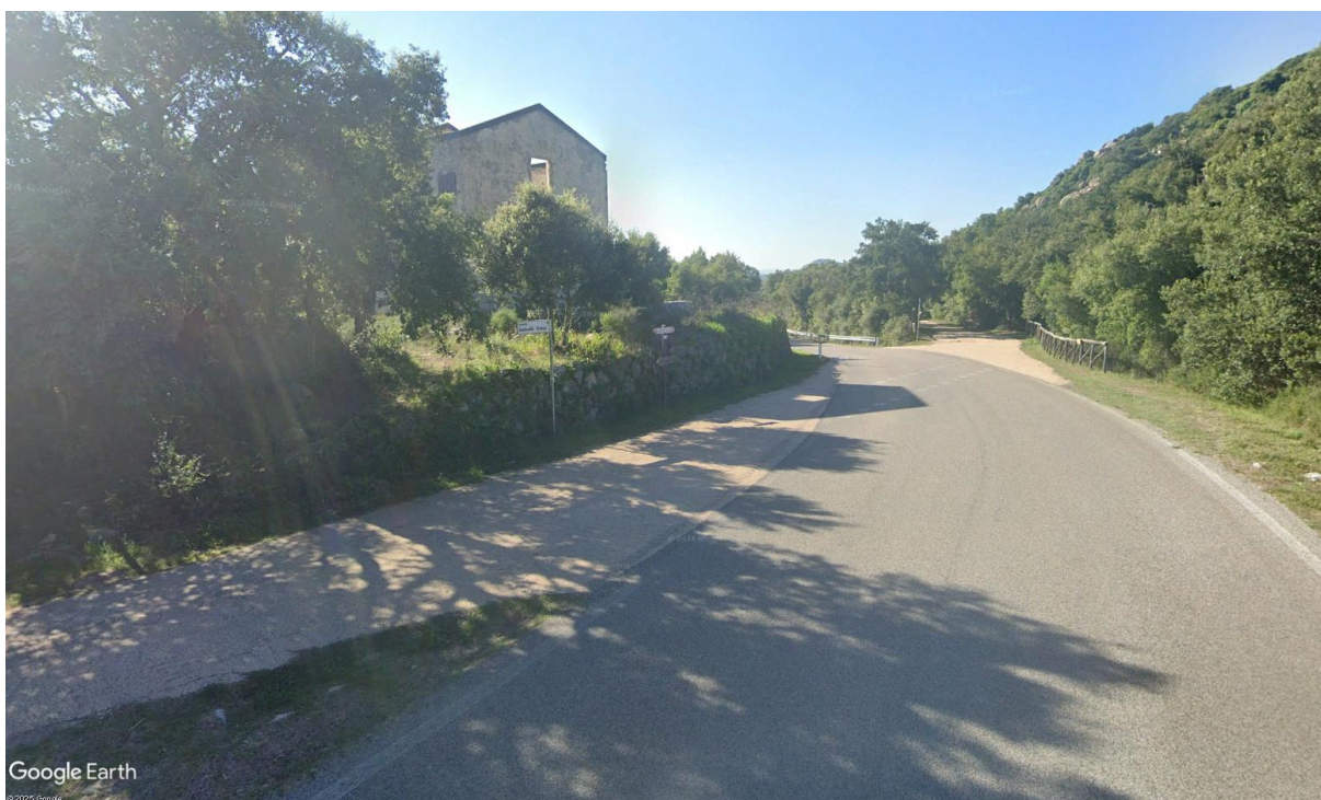
Casa Cantoniera 13 – Tratto del percorso n.39 Monti (stazione Monti-Telti) – Tempio Pausania, del PIANO REGIONALE MOBILITÀ CICLISTICA DELLA SARDEGNA e inizio percorso li Conchi sul massiccio del Limbara