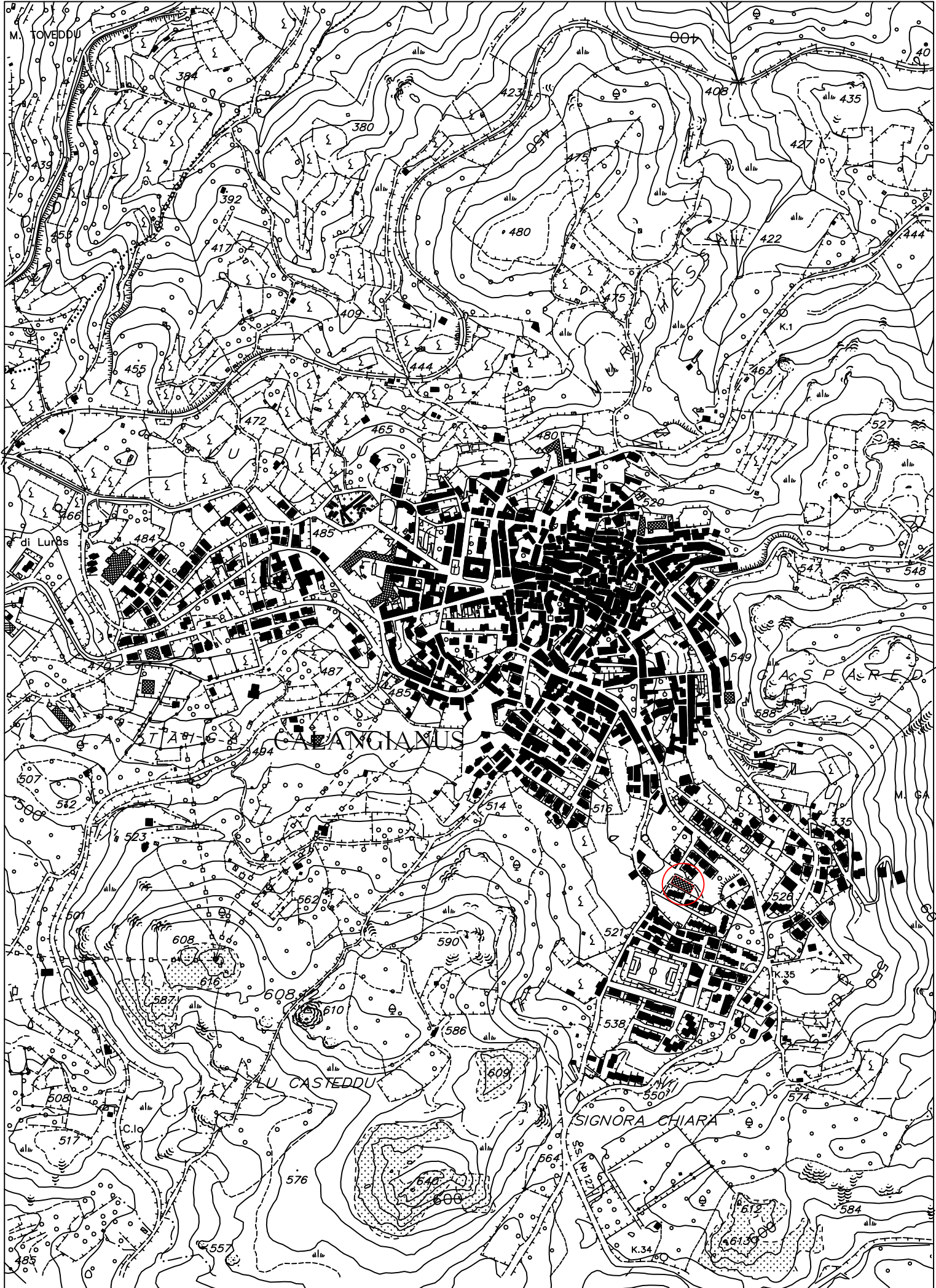
CARTOGRAFIA TECNICA REGIONALE - CTR 443070