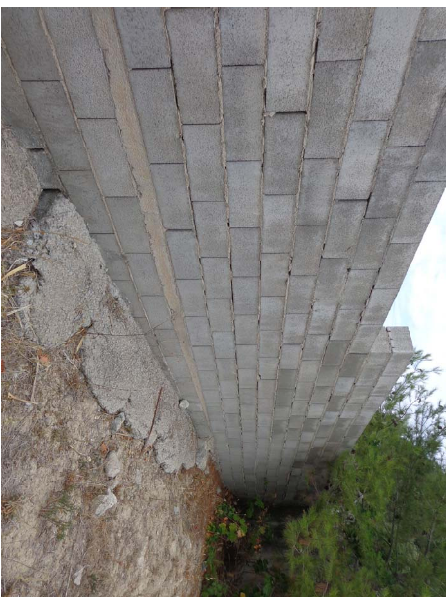
1 Fondazione muro di dimensione variabile realizzata con cls di bassa qualità e con fondo non orizzontale