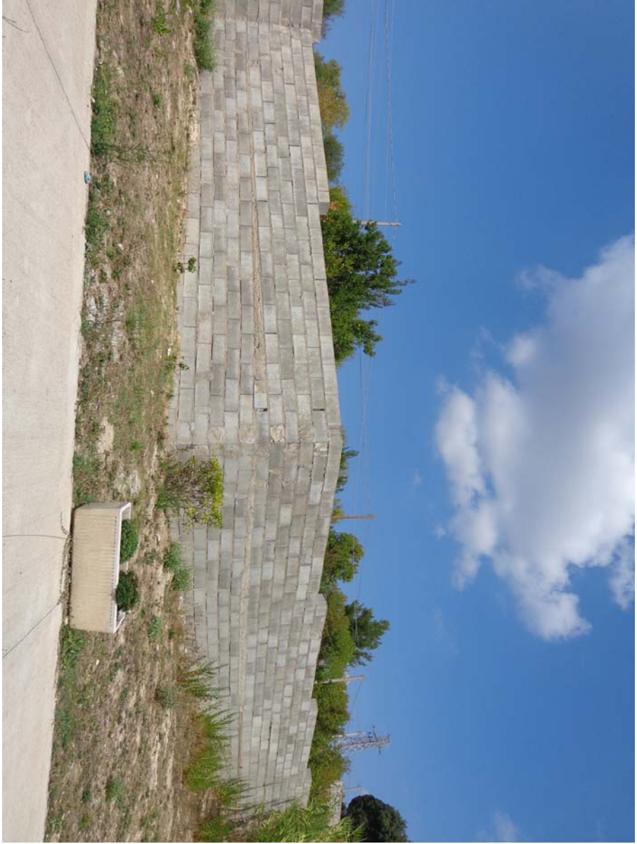
3 Presenza di uno o più riparti di livelloamento a diverse altezze della muratura.