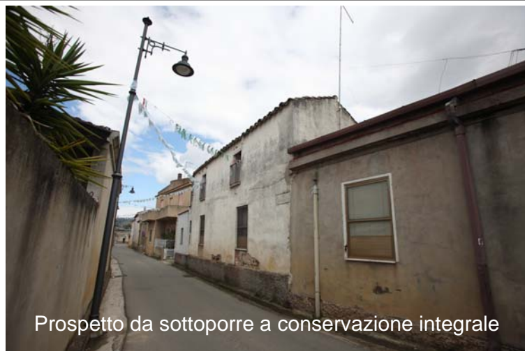
Prospetto da sottoporre a conservazione integrale