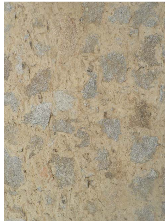
CIVICO n°7 MURATURA FACCIAVISTA TECNICA RASOPIETRA