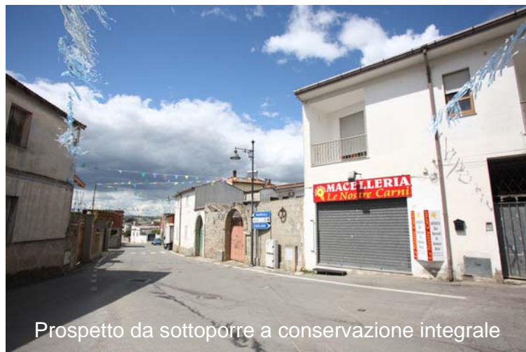
Prospetto da sottoporre a conservazione integrale VISTA N°2