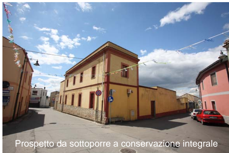
Prospetto da sottoporre a conservazione integrale VISTA N°2