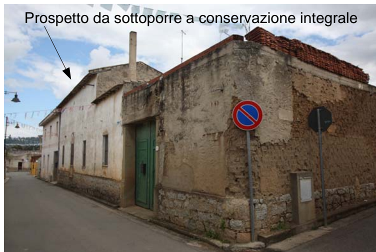
Prospetto da sottoporre a conservazione integrale