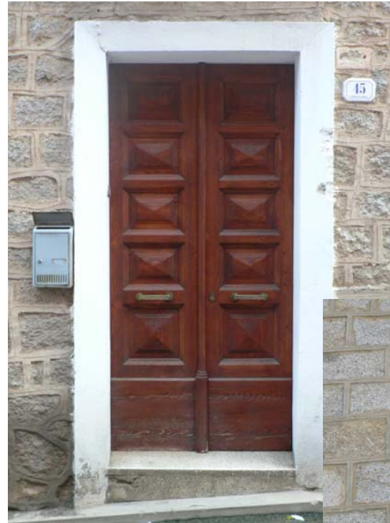
CIVICO n°45 MURATURA FACCIA VISTA CON STILATURA DEI GIUNTI