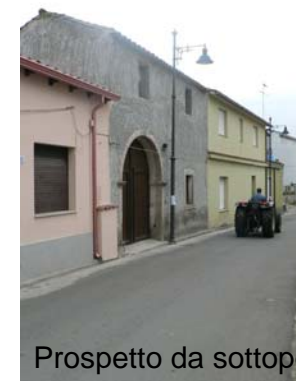
Prospetto da sottoporre a conservazione integrale