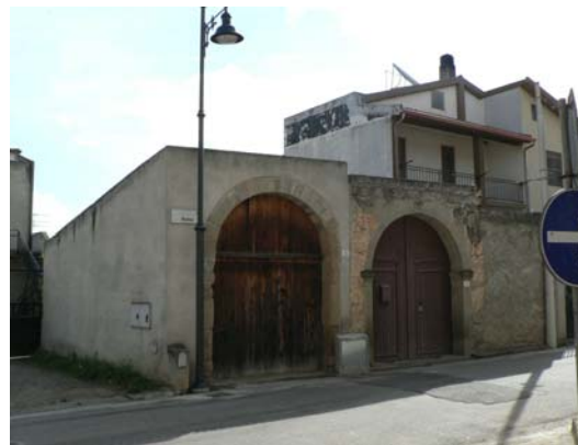
CIVICO n°41 E 43